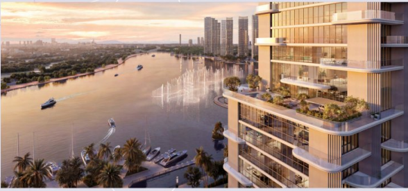
As global pioneers in architecture, engineering, and planning, SOM is renowned for shaping cities through sustainable innovation and bold, boundary-pushing design. © 2023 SOM Architecture and Engineering, Inc. All rights reserved.