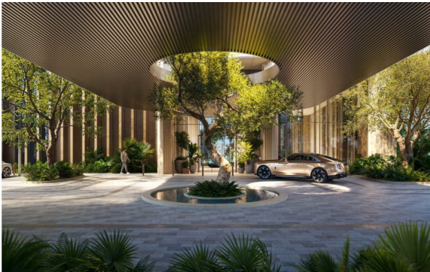
The first level includes a well-appointed gym overlooking the gardens. Layered outdoor spaces throughout the building immerse residents in nature while echoing the creative pulse of d3. From shimmering water features and shaded walkways to calming green zones, every detail is designed to foster well-being, leisure, and a seamless connection between architecture, landscape, and