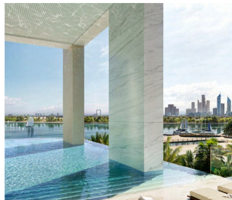
Higher up, an infinity pool and tranquil garden spaces offer residents a place for reflection and restoration, promoting both mental and physical well-being. With panoramic views of the Dubai skyline, the elevated wellness level invites residents to unwind in