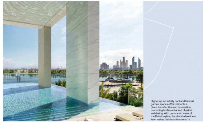
Higher up, an infinity pool and tranquil garden spaces offer residents a place for reflection and restoration, promoting both mental and physical well-being. With panoramic views of the Dubai skyline, the elevated wellness level invites residents to unwind in