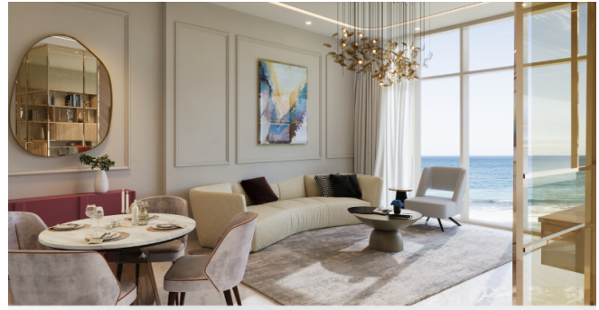
Fully furnished luxury apartments