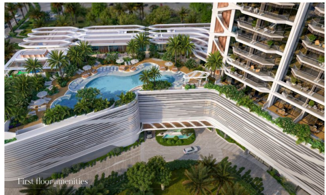
First floor amenities