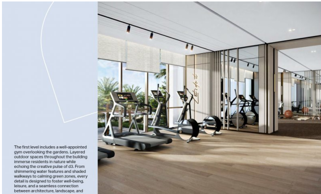
The first level includes a well-appointed gym overlooking the gardens. Layered outdoor spaces throughout the building immerse residents in nature while echoing the creative pulse of d3. From shimmering water features and shaded walkways to calming green zones, every detail is designed to foster well-being, leisure, and a seamless connection between architecture, landscape, and