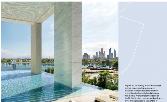
Higher up, an infinity pool and tranquil garden spaces offer residents a place for reflection and restoration, promoting both mental and physical well-being. With panoramic views of the Dubai skyline, the elevated wellness level invites residents to unwind in