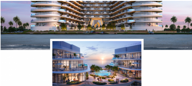
AQUA ARC BY B&W DEVELOPMENTS Discover your luxury oasis at Al Marjan Island